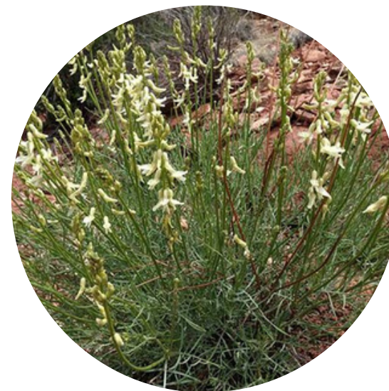
Bacteriofag sau (Chinese knotweed)