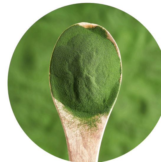
Chlorella vulgaris alga