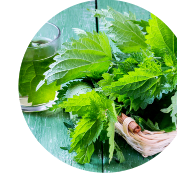
Extract de urzică