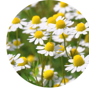
Extract de mușețel