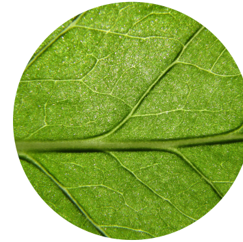
Extract de frunze de yerba mate