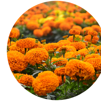
Extract de gălbenele