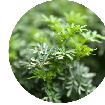
Extract de rută de grădină