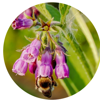
List kostihoja lekárskeho