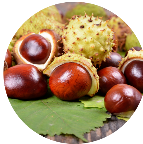
Extrakt z pagaštanu konského