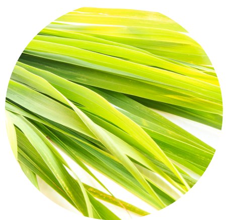
Výťažok z citrónovej trávy