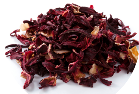
Výťažok z ibišteka