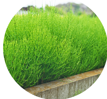
Výťažok z prasličky