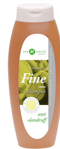
Na lupiny Vlasy