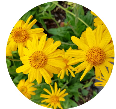
Výťažok z Arniky