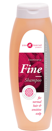
Na normálne Vlasy