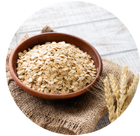
Výťažok z ovs