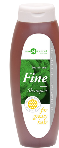
Na mastné Vlasy