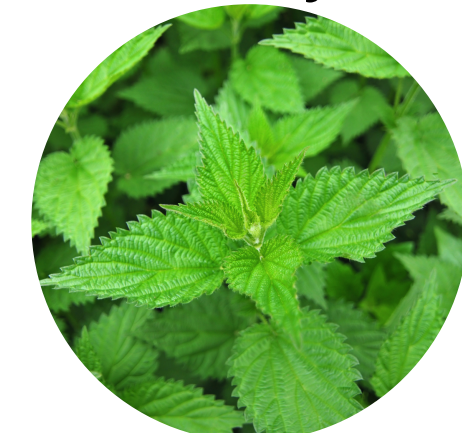
Výťažok zo žihľavy