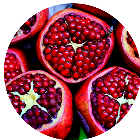
Výťažok z granátového jablka