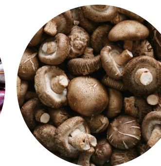
Liečivé huby Siitake