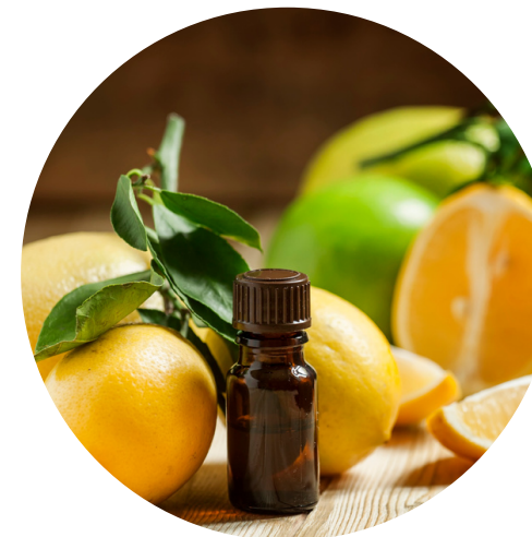
aceite de limon