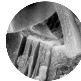
Mineral de arcilla