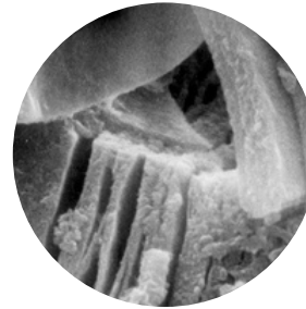
Mineral de arcilla