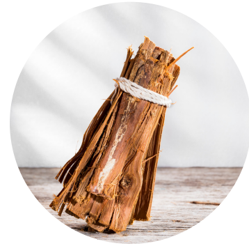
Uña de gato