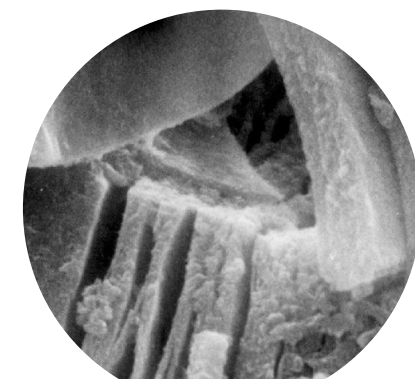
Mineral de arcilla