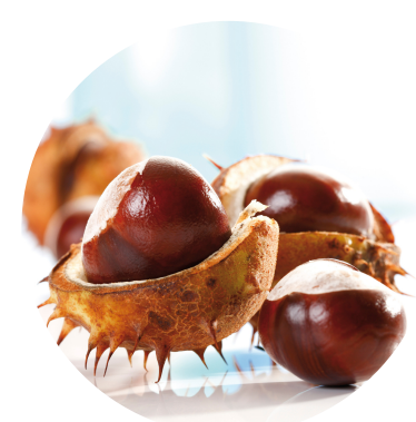
Extracto de castaño de indias