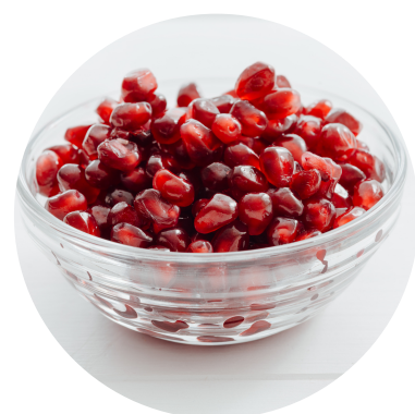
extract de sâmburi de grepfrut