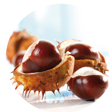
extract de castane sălbatice