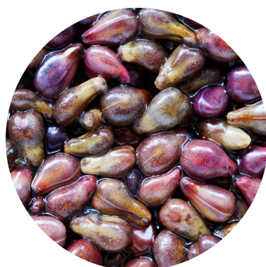
ulei de sâmburi de struguri