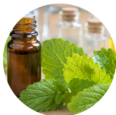
ulei de roiniță