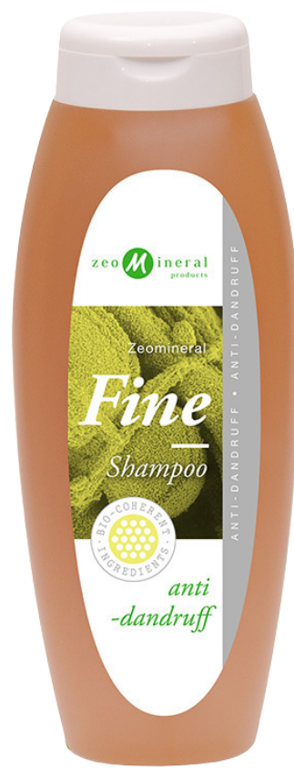
Cabello con caspa