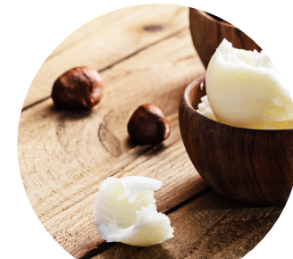
manteca de karite