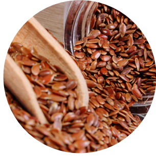
Aceite de linaza