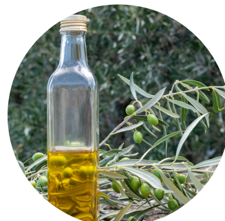
aciete de onagra