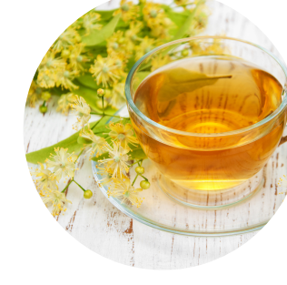
Flor de tilo