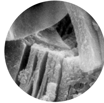
mineral de arcilla