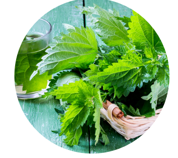
Hoja de Ortiga