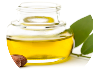
aceite de Jojoba