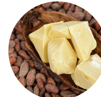
manteca de cacao