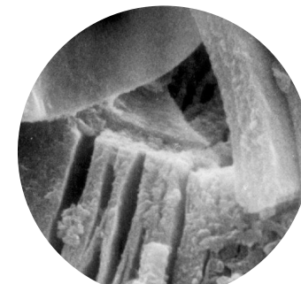
mineral de arcilla