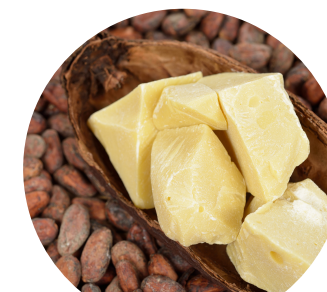
manteca de cacao