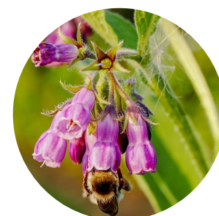
Hoja Symphytum officinale