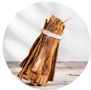
Uña de gato