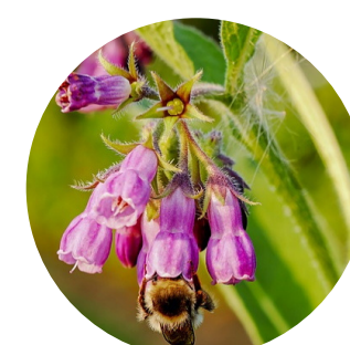
Hoja Symphytum officinale