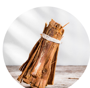
Uña de gato