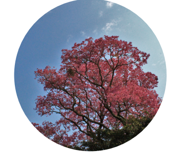
Corteza de lapacho