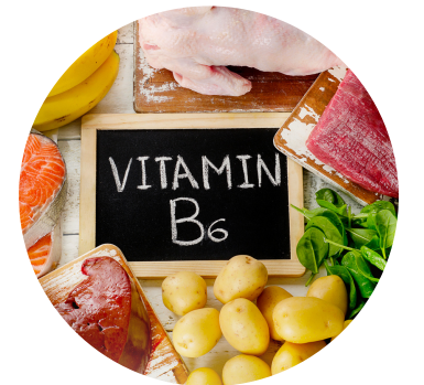
vitamina E, A y B6