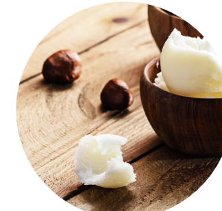
manteca de karite