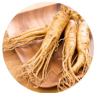
Raíz de ginseng