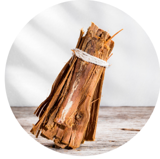
Uña de gato