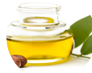
aceite de Jojoba