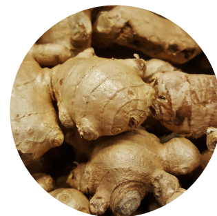
Raíz de gengibre