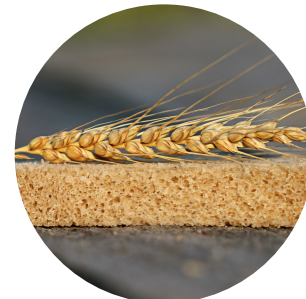
Aceite de germen de trigo