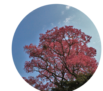
Corteza de lapacho