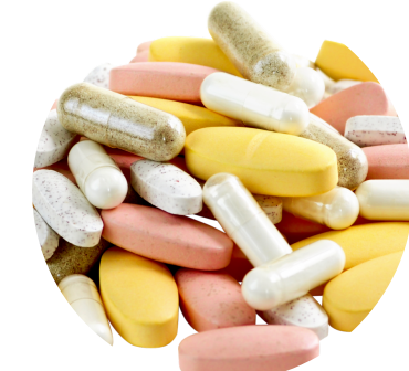
vitamina E y A