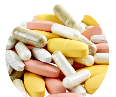
vitamina E y A