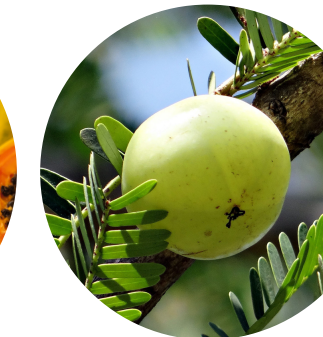
Grosella de India