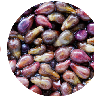
Molido de semilla de uva